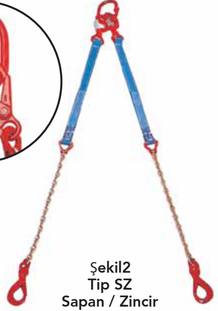
Şekil2 Tip SZ Sapan / Zincir