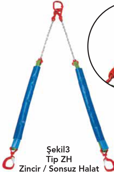
Şekil3 Tip ZH Zincir / Sonsuz Halat

BK model kanca polyester sonsuz halatlı kullanımlar için