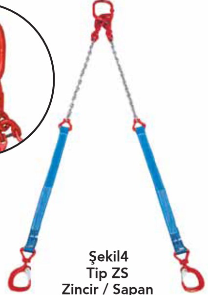
Şekil4 Tip ZS Zincir / Sapan

❗ Siparişlerinizde zincir ve polyester grubunun uzunluklarını ayrı ayrı belirtiniz. İsteğe göre sisteme kısaltma fonksiyonu eklenebilir.