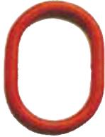
Ana bağlantı halkası 1 ve 2 bacaklı sapanlar için.