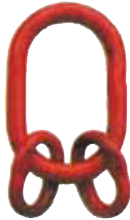
Ana bağlantı halkası 3 ve 4 bacaklı sapanlar için.